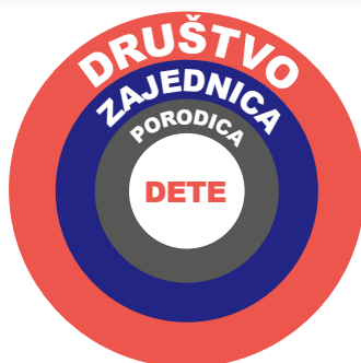
Slika 3: El Sistema menja dete, njegovu porodicu, užu zajednicu i celo društvo. Program deluje sistemom koncentričnih krugova kroz promenu ponašanja deteta na promenu njegove porodice, zajednice i društva kao celine.