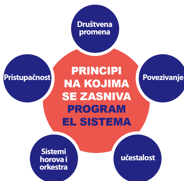
Slika 1: Principi na kojima se zasniva program El Sistema

Svi centri u kojima se implementira program povezani su na lokalnim, regionalnim i nacionalnim nivoima, formirajući povezanu mrežu usluga i mogućnosti za učenike širom zemlje.